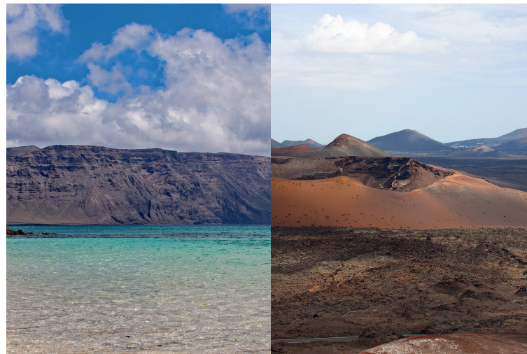
Imagen inferior izquierda: Playa Francesa La Graciosa Islas Canarias España / Volcán en parque nacional de Timanfaya. Propiedad: libre

Caminar por la isla puede ser sin duda un itinerario por el cambio constante del paisaje que nos rodea. Podemos perdernos entre volcanes, grutas o playas vírgenes en un solo día y todo unido con una paz y una calma que se palpa en el aire. Un paraíso para el alma y una pausa necesaria en nuestro caminar.