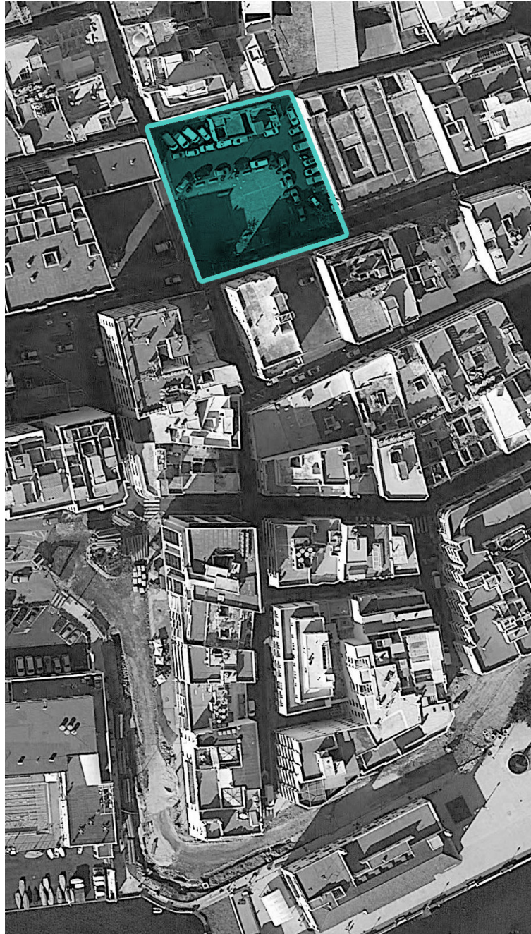
Imagen: Vista aérea de la zona de actuación.